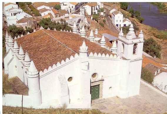
Figura 8 – Igreja-Mesquita de Mértola

II.3.2 Enumera as principais heranças dos Muçulmanos.