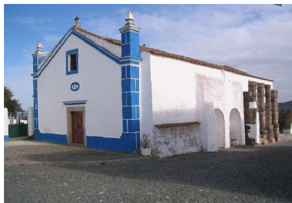
Figura 3 – Vestígios de Templo Romano na Igreja de Santana do Campo (Arraiolos)

I.2.1 Define o conceito de Romanização .