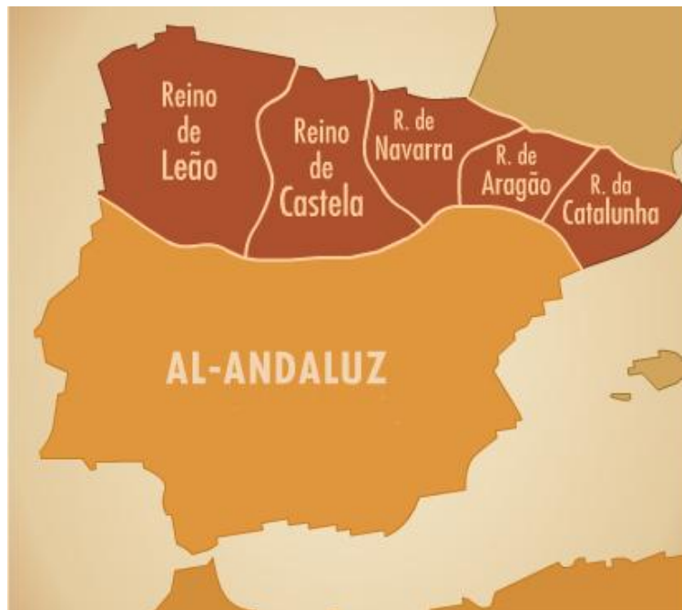
Figura 7 – Mapa da Península Ibérica, com os novos reinos Cristãos.

II.2 Observa atentamente o mapa da figura 7.