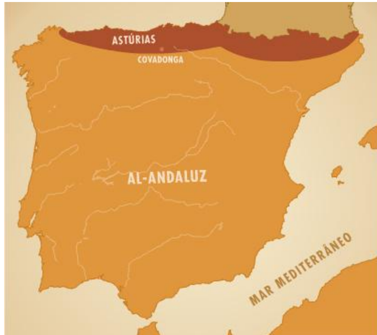
Figura 6 – Mapa da Península Ibérica. A Norte estão assinalados os territórios na posse dos Cristãos.

II.1.1 Indica as duas principais razões que levaram os Muçulmanos a invadir outros territórios.