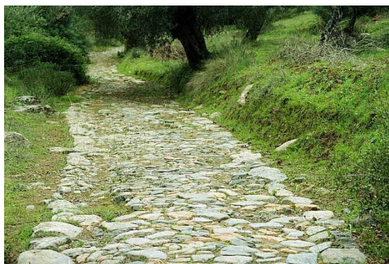
Figura 2 – Estrada Romana no Alentejo

I.2 Os Romanos quiseram conquistar a Península Ibérica, por causa das riquezas peninsulares e para aumentar o seu império. No entanto, a sua presença vai permitir aos povos que aqui viviam conhecer a cultura romana e aprender, por exemplo, as técnicas de construção romana. Analisa cuidadosamente as figuras 2, 3 e 4 .