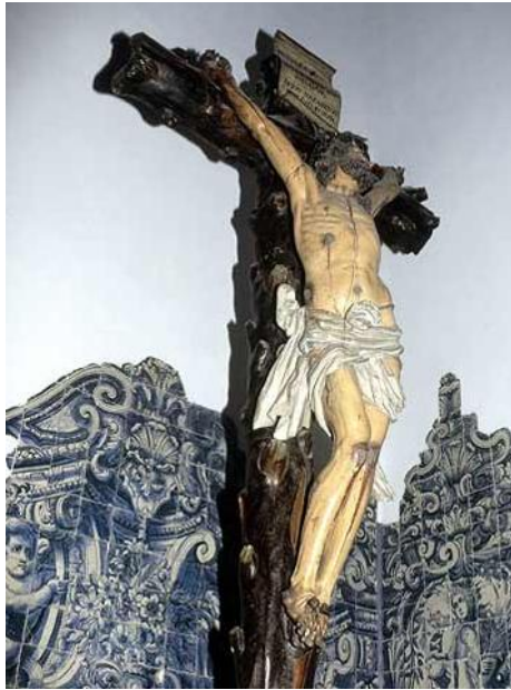
Figura 4 – Representação de Jesus Cristo Crucificado

I.3.1 O Cristianismo, ao contrário da antiga religião dos romanos, era uma religião monoteísta . O que é que isso quer dizer?